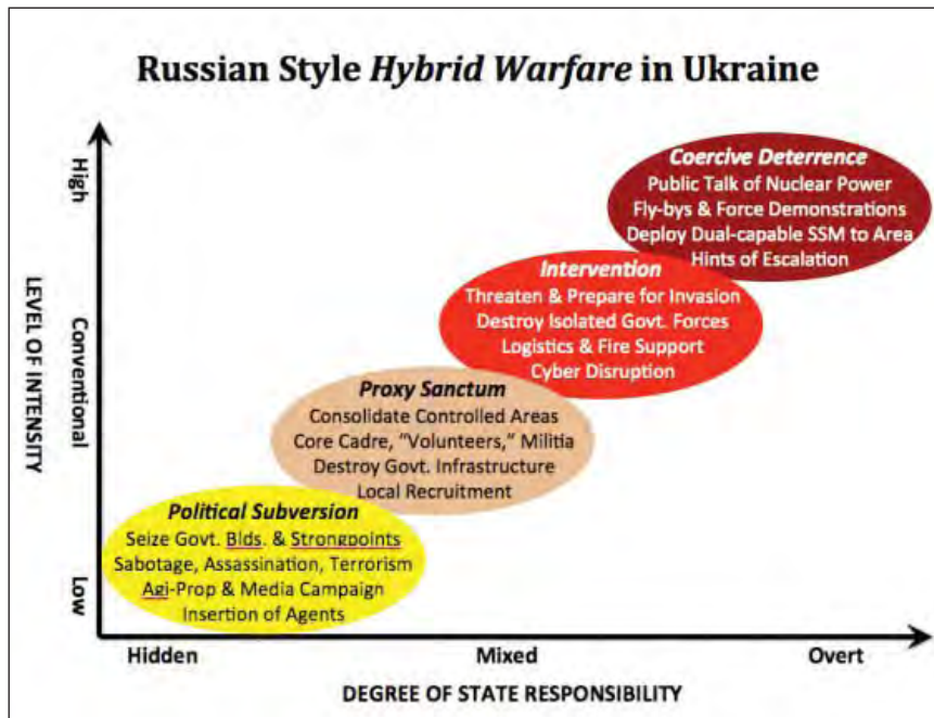
Figura nr. 1: Războiul hibrid aplicat în Ucraina 4

- așa-numiții „omuleți verzi” neidentificați au fost coordonați și ghidați cu precizie în acțiunile lor, ocupând puncte cheie și au ocupat clădirile guvernamentale principale din zonă;