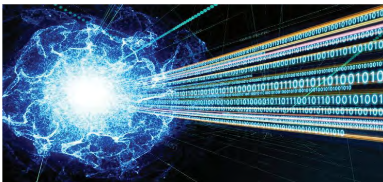
Figura nr. 2: Cum se realizează internetul cuantic 7

perioadă, însă, un grup de șase cercetători de la IBM au preluat ideile teoriei cuantice a lui Bohm, pe care au combinat-o cu celebrul efect Einstein-Podolski-Rosen (EPR) 5 , demonstrând că teleportarea perfectă este cu adevărat posibilă în principiu, cu condiția ca originalul să fie distrus. Astfel, ei au reușit să găsească o modalitate, conform Figurii nr. 1, de a măsura o parte din proprietățile obiectului A, care se dorește a fi teleportat, în timp ce au făcut ca cealaltă parte de informații, necunoscute, ale obiectului A, să treacă – prin efectul EPR – în alt obiect, C, obiect care nu a fost în contact cu A. Mai târziu, aplicând obiectului C un tratament conform cu informația ‘citită’ de la A, este posibil ca să se modifice starea lui C, astfel încât acesta să devină identic cu A, în starea în care era înainte de scanare. Obiectul A nu mai este în aceea stare de început din moment ce a fost scanat, deci ceea ce s-a obținut este teleportare, și nu replicare. Restul de informație care nu a fost scanată de la A, este transmisă de la A la C prin intermediul unui al treilea obiect, B, care interacționează, mai întâi, cu C și apoi cu A. Poftim? Este corect așa ceva? Adică ‘mai întâi cu C și apoi cu A’? Bineînțeles, în mod obișnuit, ca să obținem ceva de la A la C, trebuie mai întâi să accesăm A și apoi C, și nu invers 6 .