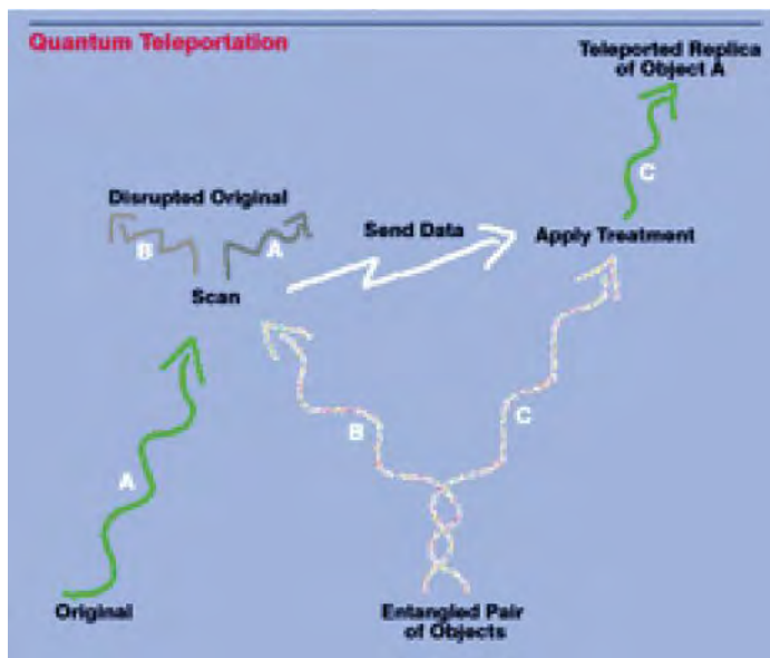
Figura nr. 1: Teleportarea cuantică 4

unei teleportări care să conțină mai puține riscuri. Unele dintre teoriile care au urmat acestui experiment, s-au referit la conjectura protecției cronologice (curba închisă de tip temporal sau așa-numita „gaură de vierme”) 2 , principiul autoconsistenței al lui Novikov 3 și chiar mecanica cuantică a călătoriei în timp.