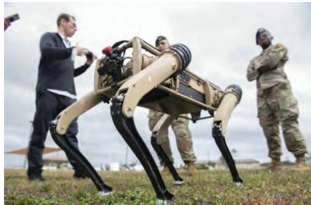
Figura nr. 5: Câinele-robot realizat pentru patrularea bazelor militare americane 21