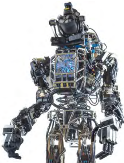
Figura nr. 4: Robotul biped „ATLAS” creat de DARPA 20

În același timp, agenții și companii guvernamentale lucrează pentru dezvoltarea unor roboți umanoizi și tip „câini de pază” (a se vedea Figurile nr. 4 și 5), care să poată merge, alerga, sări sau folosi mâinile, în vederea posibilei înlocuiri a tot ceea ce oamenii pot face, mai ales în domeniile de nișă. Această tehnologie robotizată are o destinație duală, produsele sale putând fi folosite atât în sfera comercială, cât și în cea militară. Costurile reduse de producție, cantitatea mai mică de combustibil lichid folosită, precum și acuratețea crescută în proiecte, cum ar fi cel al mașinii cu pilot automat sau dronelor de livrare, sunt la fel de eficiente în viața civilă, cât și în cea militară. Roboții militari destinați înlocuirii personalului în poziții periculoase sunt doar începutul acestor vaste cercetări științifice. Ele vor fi urmate de robotizarea logisticii, pentru că sistemele autonome de transport și dislocare terestră, aeriană sau maritimă sunt deja în dezvoltare prin aplicații civile, la care participă și agenții/laboratoare de cercetare pentru apărare. Este cazul mașinii pilotate automat, la care participă și DARPA cu proiectul „Grand Challenge”.