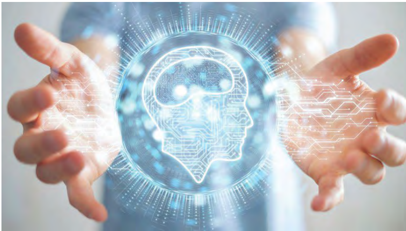
Figura nr. 3: Sistemul de inteligență artificială GPT-3 9

Dar teleportarea cuantică nu se referă la deplasarea obiectelor dintr-un loc în celălalt, ci la deplasarea informației cuantice, care trebuie transmisă prin intermediul particulelor de lumină, denumite fotoni (a se vedea Figura nr. 2). La începutul acestui an, o echipă Fermilab a Departamentului pentru Energie din SUA, împreună cu NASA și cu cercetătorii de la Universitatea Calgary, au reușit să teleporteze biți cuantici de fotoni de-a lungul a 44 de kilometri de fibră, ceea ce reprezintă o premieră în știința mondială și o realizare majoră pentru domeniul IT. 8 Este primul pas care duce la legarea calculatoarelor cuantice, deja existente în lume, ca să poată comunica între ele pe viitor. Scopul final al acestor experimente, așa cum afirmă fizicianul român Cristian Prescură, este acela de a realiza un internet cuantic, care să asigure transportul datelor cuantice dintr-o parte în cealaltă, în așa fel încât calculatoarele cuantice să lucreze toate la unison. Se lucrează deja la o astfel de rețea, în apropiere de Chicago, care va deveni primul internet cuantic din lume, iar perioada de realizare se preconizează a fi în următorii 50 de ani.