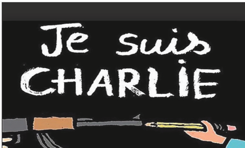
Figura nr. 1: Caricatură realizată ca reacție în urma atacurilor teroriste din 7 ianuarie 2015 din Paris

entitate distinctă. Din moment ce fundamentele unei comunități pot fi identificate ca fiind suma valorilor, a normelor, a tuturor acțiunilor și comportamentelor care determină confluența, coexistența și vectorul de unitate al acesteia, atunci nu trebuie să facem altceva decât o evaluare și o determinare a propriului sistem de educație ce definește comunitatea pe care o localizează spațial și temporal 8 .