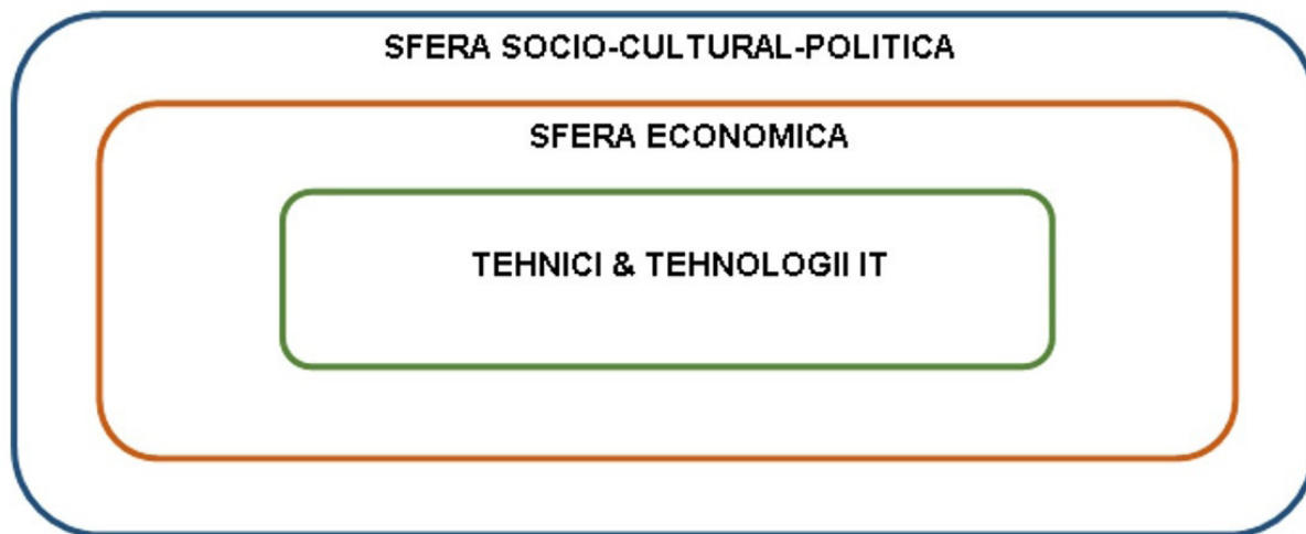
Figura nr. 1: Un model stratificat al societății informaționale 20

3. Aspectul social – datorită faptului că există un procentaj ridicat de persoane care utilizează IT la muncă, la școală sau acasă, raportat la