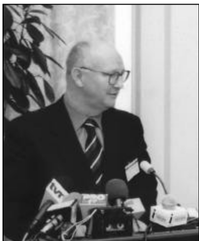
Dr. IOAN MIRCEA PAȘCU, ministrul Apărării Naționale

Aderarea la Alianța Nord-Atlantică reprezintă o prioritate fundamentală a actualului Guvern și, în același timp, principalul obiectiv al politicii de apărare, din perspectiva pregătirii pentru Summit-ul NATO de la Praga, din anul 2002.