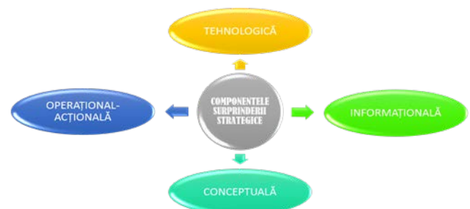
Figura nr. 1: Componentele surprinderii strategice 1

cu ceea ce se remarcă a fi imprevizibil, o sferă variată de fenomene neașteptate, care se adresează psihicului uman, în principal. Lupta armată, ca element de referință al artei militare, implică în definirea și analiza surprinderii la nivelul strategic al artei războiului, cel puțin patru perspective, ce se regăsesc în figura de mai jos: tehnologică, informațională, conceptuală și operațional-acțională.