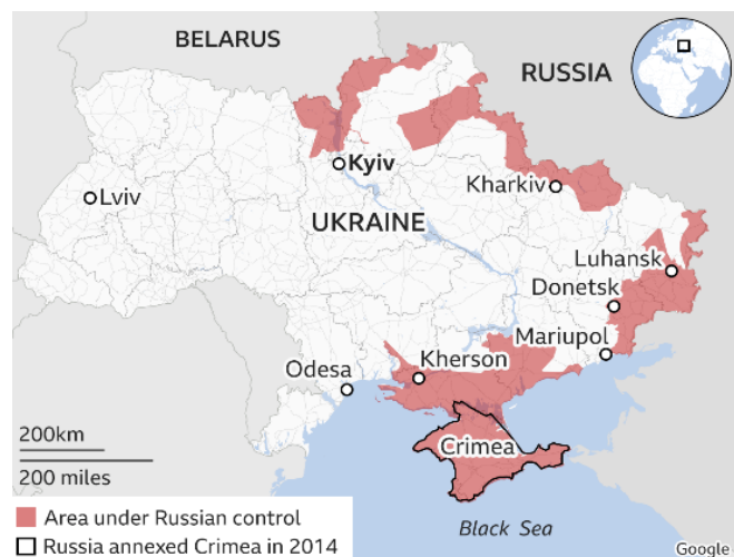
Figura nr. 1: Situația generală a conflictului armat din Ucraina la 1 martie 2022 (The Visual Journalism Team 2022)

damente și lovituri cu rachete balistice și de croazi-eră). Tot cu această ocazie, a anunțat că țara sa rupe relațiile diplomatice cu Federația Rusă, ca urmare a acestor atacuri nemiloase, inumane și ilegale, lucru reiterat în fiecare zi a războiului și aproape a implorat cetățenii ruși „care încă nu și-au pierdut onoarea”, să protesteze împotriva acțiunilor militare (Radio Free Europe/Radio Liberty 2022).