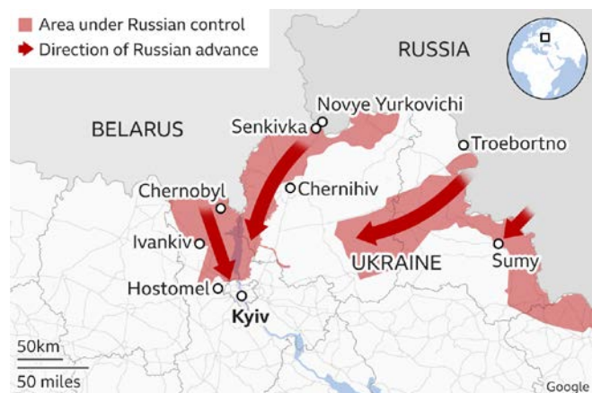
Figura nr. 2: Situația în zona de nord a conflictului din Ucraina la 1 martie 2022 (The Visual Journalism Team 2022)

În nord, trupele ruse au trecut granița cu Ucraina pe la Cernobil și, respectiv pe la Senkivka, într-un atac convergent către Kiev, cu scopul de a cucerii capitala și a înlătura regimul politic ucrainean. Pe direcția Mazyr, Kiev, forțele ruse (unități de infante-