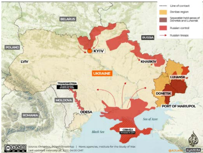
Figura nr. 5: Acțiunile viitoare (Child, et al. 2022)

În sud, ofensiva s-a desfășurat tot pe direcții interioare, pornind de pe granița ( de facto ) dintre Crimeea și Ucraina, în scopul extinderii teritoriului controlat către centrul Ucrainei și către portul Odessa și, simultan, realizării joncțiunii cu forțele care atacă dinspre est. Cel mai probabil, se intenționează decuplarea Ucrainei de la Marea Neagră și Marea Azov, prin cucerirea și controlul litoralului și al porturilor.