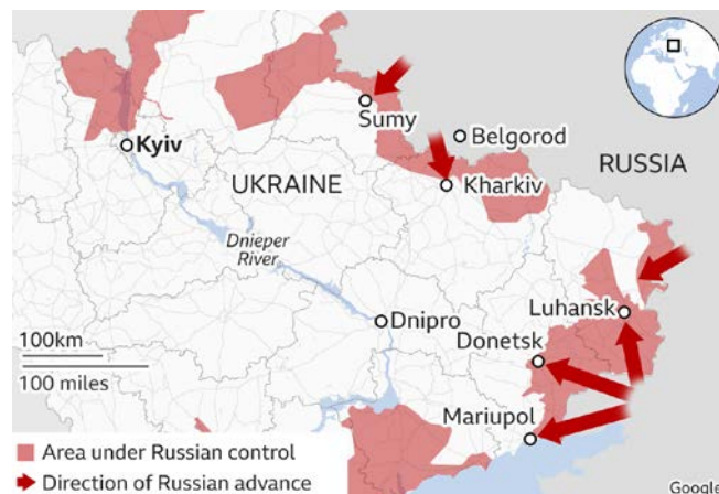
Figura nr. 3: Situația în zonele de nord-est și est ale conflictului din Ucraina la 1 martie 2022 (The Visual Journalism Team 2022)

rie și tancuri de valoare regiment), au înaintat rapid, ajungând, până în suburbiile capitalei. Pe cealaltă direcție, dinspre Gomel, ritmul ofensivei a fost unul mai redus, astfel încât planul de a ataca simultan din două direcții nu a avut succes. Este de așteptat ca forțele ruse care atacă dinspre nord-est (Troebortno) să constituie o a treia direcție de ofensivă cu scopul de a cucerii capitala printr-o manevră pe direcții exterioare.