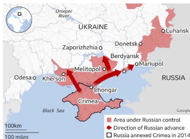
Figura nr. 4: Situația în zona de sud a conflictului din Ucraina la 1 martie 2022 (The Visual Journalism Team 2022)

În est, atacul a fost unul divergent (manevră pe direcții interioare), cu scopul de a lărgi „capul de pod” reprezentat de teritoriul ocupat de separatiști în Donbas. Acțiunile s-au desfășurat pe trei direcții, vizând, în special, menținerea controlului asupra portului Mariupol și al celor două orașe Donețk și Luhansk, cucerirea teritoriului până la orașul Dnipro și realizarea joncțiunii cu forțele care atacă dinspre sud (Crimeea).