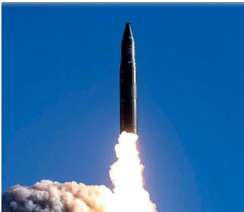
Ilustrația 1: China testează un ICBM modern, DF-31 AG, septembrie 2024 (Zhang 2024)

Cele patru exemple sugerează concluzii similare cu cele care rezultă din analiza capacităților generale și a potențialului militar. RPC este o mare putere și deține a doua poziție în cadrul unui sistem bipolar, în care SUA se situează pe primul loc, iar restul actorilor internaționali se află la o distanță semnificativă în termenii resurselor de putere combinate. Autoritățile de la Beijing urmăresc o strategie care-și propune extinderea acestor capacități și, cel puțin, paritatea cu, dacă nu depășirea Washingtonului. Acest lucru nu înseamnă că actorul nu are vulnerabilități sau că tranziția de putere este inevitabilă, dar dezvoltarea forțelor nucleare de anvergură sau a portavioanelor ne indică destul de clar intențiile, fiind vorba despre instrumente consacrate de mare putere.