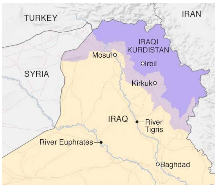
Figura nr. 2: Teritorii controlate de forțe kurde 20

și care să cuprindă zona autonomă controlată de etnicii respectivi, așa-numitul Kurdistan irakian, acoperind teritoriul prezentat pe harta de mai jos.