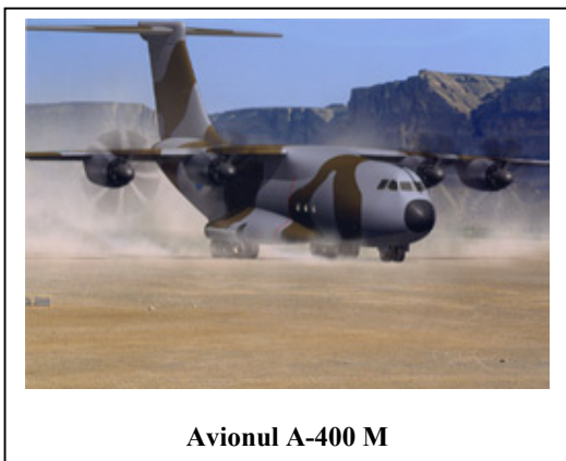
Avionul A-400 M

Aeromobilitatea – apărută în timpul celui de al doilea război mondial – va constitui, în continuare, una dintre dimensiunile specifice ale războiului viitorului. Ea trebuie înțeleasă în flexibilitatea și dinamismul ei, în dimensionarea corespunzătoare